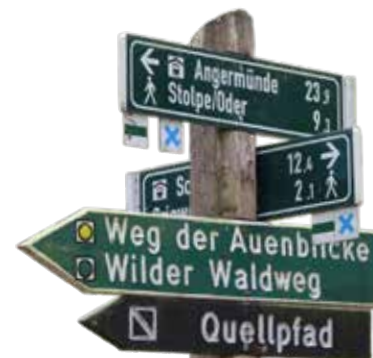
Wanderungen verbinden gesunde Bewegung mit der Freude an der Schönheit der Natur.