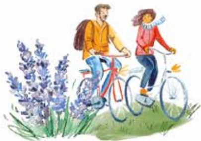
Mit dem Rad unterwegs – der Kopf wird frei, der Körper kommt in Schwung.

Oft besteht im Alter außerdem die Gefahr einer schleichenden Vereinsamung. Steuern Sie aktiv dagegen und nehmen Sie Angebote in Ihrem Umfeld wahr – wie beispielsweise Sportvereine, Seniorenfeste, Veranstaltungen in jeder Form. Lassen Sie Einladungen nicht aus, auch wenn es zeitlich eng wird oder Ihnen