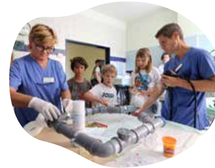
Unter dem Schlagwort DIAMANT (Abkürzung für: DIAbetes Mit ANderen Teilen) führt das Klinikum auf kreative Weise Schulungswochen für Kinder mit Diabetes durch.