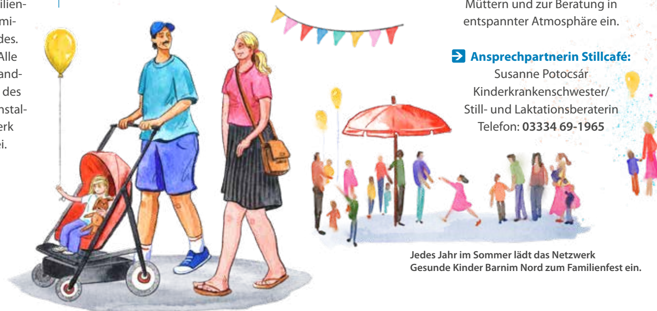
Jedes Jahr im Sommer lädt das Netzwerk Gesunde Kinder Barnim Nord zum Familienfest ein.