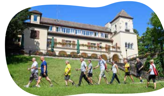
Laufen ist Therapie – so auch im Rahmen der Rehabilitation in der GLG Fachklinik Wollletzsee.

schwer fallen sollte, sich in ungewohnter Umgebung aufzuhalten. Erzählen Sie anderen aus Ihrem Leben, pflegen Sie nachbarschaftliche Kontakte – auch zu jüngeren Menschen. Veranstaltungskalender Ihrer Region sind beispielsweise in Broschüren, Lokalzeitungen, Amtsblättern und im Internet zu finden und eröffnen Ihnen ein erstaunlich breites Spektrum an möglichen Aktivitäten. Dazu kommt die Nähe der Hauptstadt Berlin mit ihrem geradezu unerschöpflichen kulturellen Angebot.