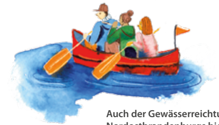
Auch der Gewässerreichtum Nordostbrandenburgs bietet viele Möglichkeiten zur aktiven Erholung.

Älter zu werden bedeutet nicht Rückzug, sondern Teilnahme an der ganzen Bandbreite aktiven Lebens. Auch als Pflegebedürftiger kann man – je nach Gesundheitszustand – nach passenden Möglichkeiten suchen. Als pflegender Angehöriger sollte man dies sogar unbedingt tun! Denn es ist wichtig, die eigenen Kraftreserven immer wieder aufzufrischen. Zugleich ermöglicht einem das Älterwerden, mehr und mehr auf das eigene Leben zurückzublicken. Da sind Erfolge, glückliche Momente, Verbindungen zu den liebsten Menschen, aber auch Situationen, in denen das eine oder andere nicht so gut, nicht wie gewünscht, verlief. Das Erinnern kann zu einer aktiven und bereichernden Ausein-