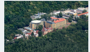
Werner Forßmann Krankenhaus