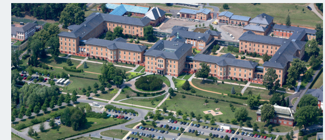
Luftaufnahme Martin Gropius Krankenhausgelände